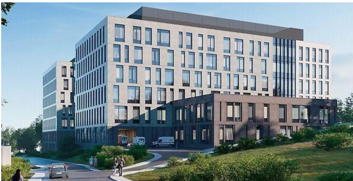
Актуализация - Уточнено представителем компании